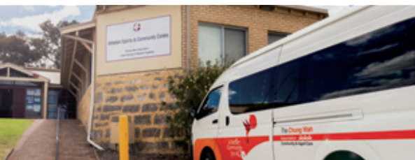
Chung Wah Community & Aged Care WILLETTON HUB 58 Burrendah Boulevard, Willetton

04-05 Your Next Stop to Wellness – Northbridge Community Hub 下一站身心健康 – 北桥社区中心 Điểm dừng chân tiếp theo của quý vị trên hành trình đến với Sống Khỏe – Trung tâm Cộng đồng Northbridge