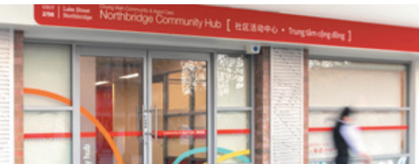
Chung Wah Community & Aged Care NORTHBRIDGE COMMUNITY HUB 2/98 Lake St, Northbridge