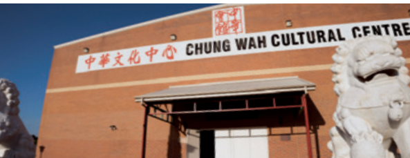
Chung Wah Community & Aged Care BALCATTA HUB 18 Radalj Place, Balcatta