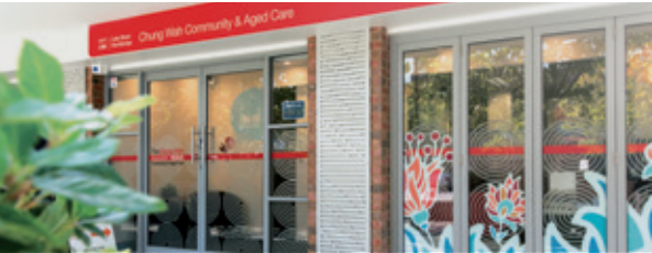
Chung Wah Community & Aged Care HEAD OFFICE 1/98 Lake St, Northbridge